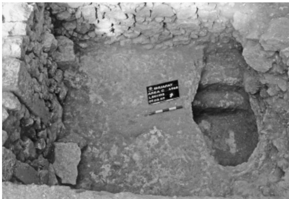
מבנן 3, מקווה חצוב במרתף החדר.