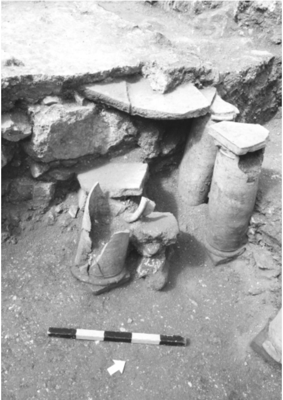
עמודי ההיפקאוסט בבית המרחץ הדרומי.