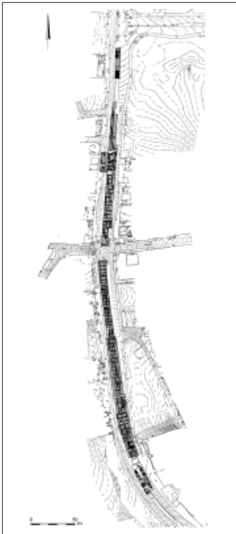
תוכנית כללית של שטחי החפירה.