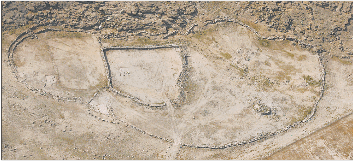
כף הרצל שימנה את נוכחותו של האל על הארץ ונצטום אודו של האזור באבנו

מוסכם. כאן נפגשו נערים ונערות, בוצעו שידוכים, נרקמו קשרים חברתיים והתנהל מסחר. עבודת הבנייה הרבה ותחוקת האחרים האלה לא יכלו להיות פרויקט של משפחה או אפילו חמולה, אלא של קולקטיב רחב. התגליות הללו מצטרפות לתגליות נוספות של ורטל, המחוקקת את התפיסה המקראית של ארגון חברתי ומנהיגות במאה ה-12 לפני הספירה. נדרש קהל רב כדי להקים ולתחזק וק לאורך זמן מפעלים כאלה. הרבך החברתי של הקהילות הללו היה, בראש ובראשונה, אתרי הפולחן שלהן. נוסף לכך את הארכיטקטורה המשותפת של המתחמים והחרסים הוהים, ונקבל מושג על ראשיתו של ישראל כעם.